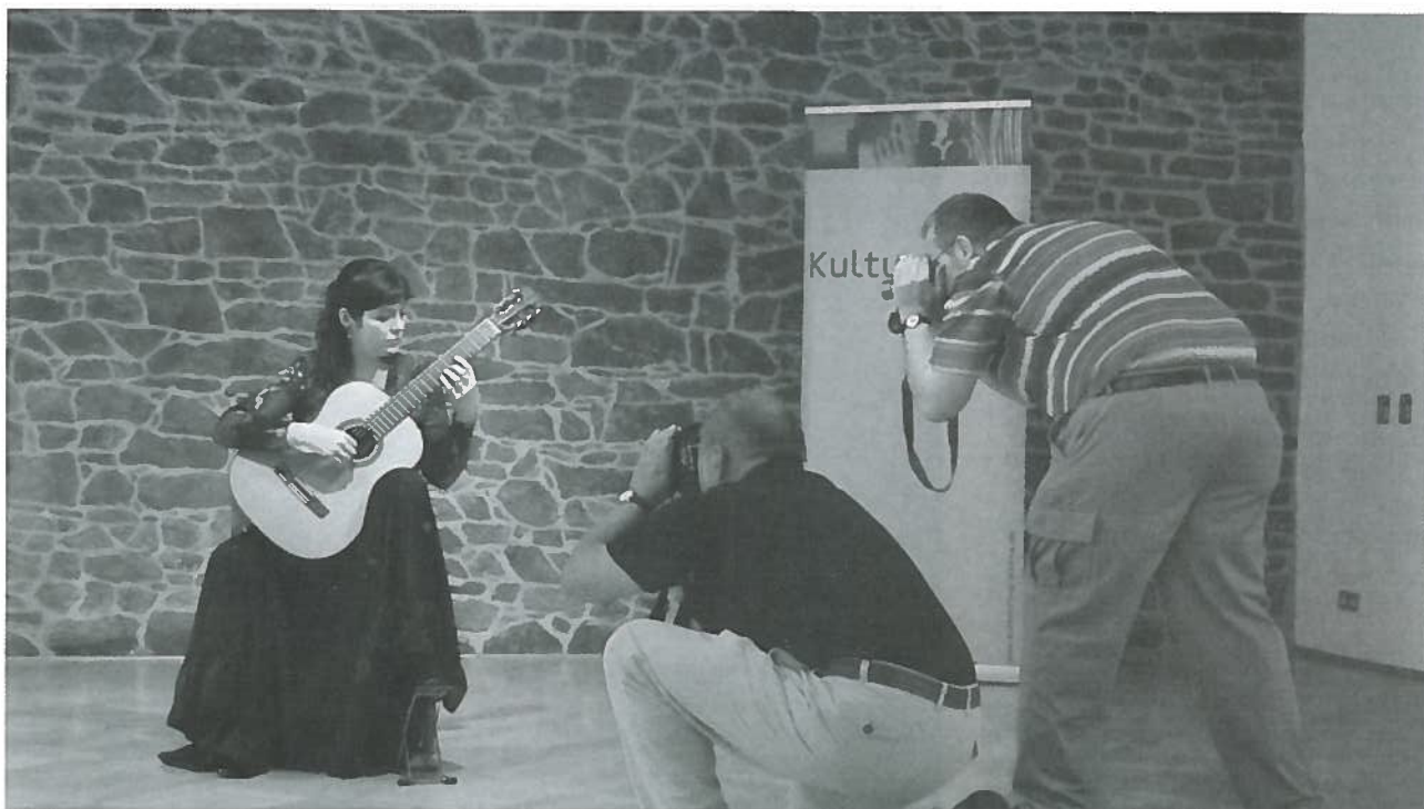
Перед концертом в Алтене, Германия