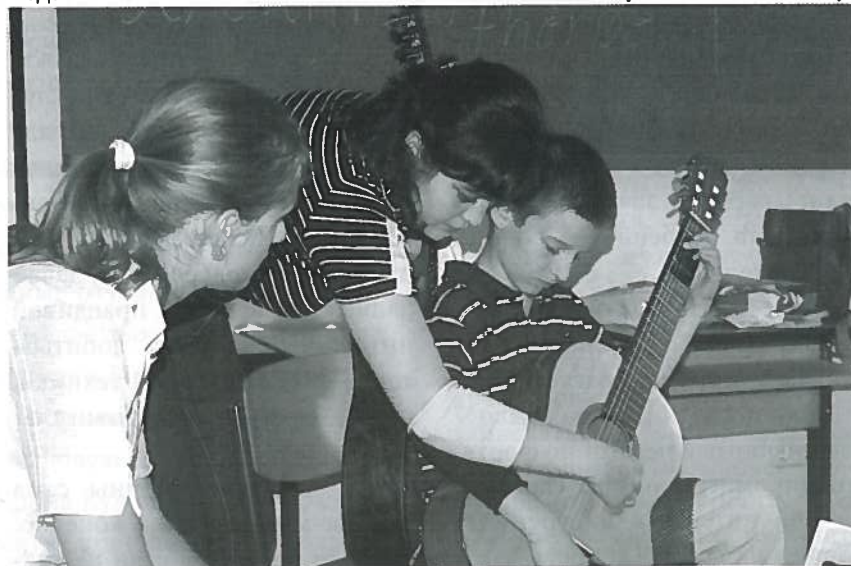
Мастер-класс в Венгрии

В Европе, особенно в высших учебных заведениях, студенты полностью самостоятельны – они сами отвечают за себя, за качество своей подготовки. Результат работы зависит только от того, насколько сильна целеустремленность каждого. Есть свобода, которая, с одной стороны, помогает – успеваешь заниматься всем, чем хочешь: ездить на конкурсы, играть концерты – без страха, что пропустишь занятия, не сдашь экзамен, и тебя отчислят. Но, с другой – некоторых такая свобода расслабляет. Педагог не несет за студента никакой ответственности, нет так называемых дополнительных уроков... Отчисления за неуспеваемость, как такового, тоже нет. Во-первых, за учебу платишь, и если не успеваешь всё сдать в сроки, то просто дольше учишься. И потом – из предметов по выбору сам определяешь, какие изучать в этом году,