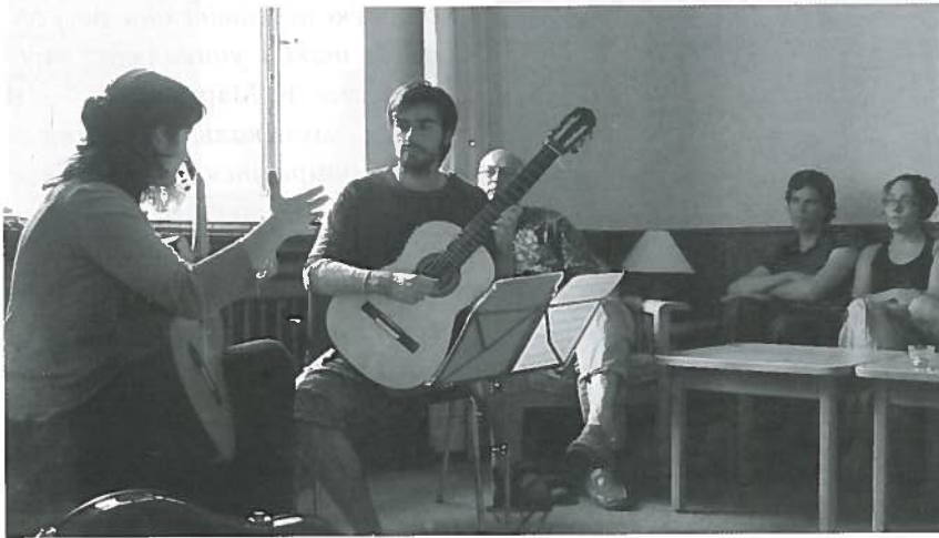
Мастер-класс в Изерлоне, Германия