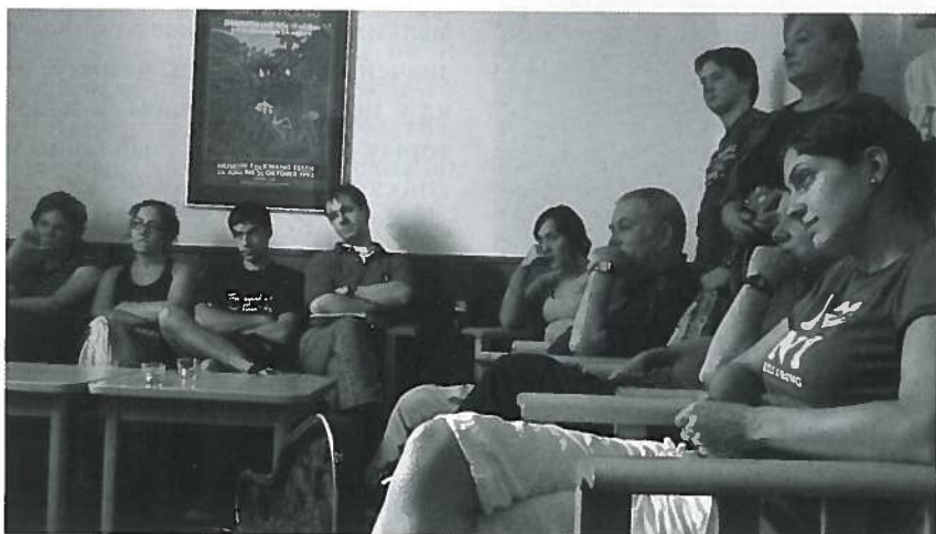
Мастер-класс в Изерлоне, Германия

а какие в следующем. Можешь передавать 2–3 раза... Сессии нет, есть экзамены по специальным предметам. По гитаре, например, для концертного диплома нужно подготовить разную программу на 2 концерта (первый проходит в аудитории для жюри, куда в качестве слушателей допускаются и студенты, а второй - в концертном зале: печатаются афиши, программа, приходят все желающие, жюри тоже в зале, среди слушателей). Очень серьезно проходит защита дипломного проекта. От выбора темы зависит, какой станет твоя работа: артистической, педагогической или научной. Что касается языка при поступлении, то всё определяется специализацией – для будущих педагогов немецкий обязателен. Мне же при поступлении было достаточно английского. Очень много предметов преподается на этом языке, в том числе, специальность. Свою дипломную работу я тоже писала на английском (ее тема звучит в вольном переводе как «Мистерия звука и целостность музыканта. Мультидисциплинарное введение для достижения успеха на сцене». – М. Л.).