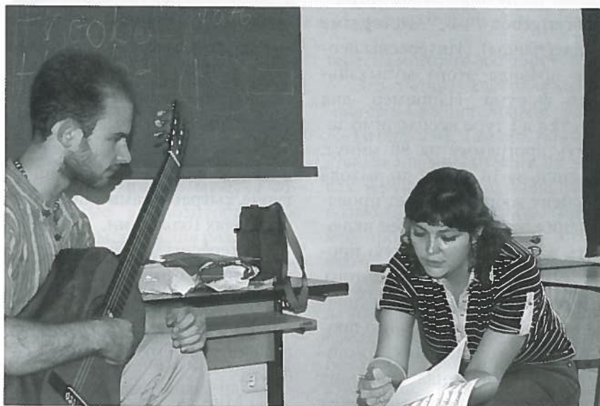
Мастер-класс в Венгрии

Конкурс-член WFIMC – Международный гитарный конкурс им. М. Питталуги, Алесандрия (Италия);