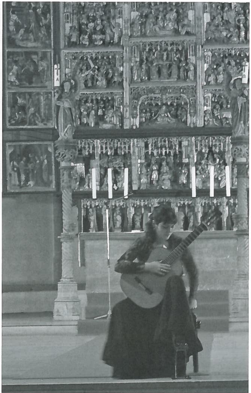
Гитарный фестиваль в Изерлоне, Германия